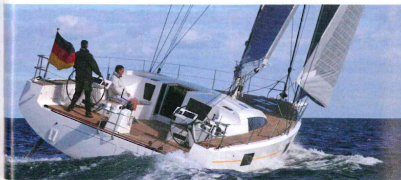
Lungo fuori tutto 17,33 metri e largo 5,26, pesa solamente 8800 kg.

unidirezionale nelle zone sollecitate da alto carico. Il cantiere ha previsto anche una versione Race, dove le pelli saranno completamente in carbonio biassiale e unidirezionale. La differenza di dislocamento, in questa seconda versione sarà di circa 1000 kg in meno. Il piano velico standard prevede una randa di 125 metri quadri più 90 di fiocco al 108% (137+93 nella versione Race). Una linea esterna moderna ed essenziale, un layout di coperta funzionale e un grande cockpit consentono efficienza nelle manovre in regata e il massimo relax nella vita all'aria aperta in crociera. Nauta Yacht Design ha progettato gli spazi sottocoperta per ottenere due comode cabine ospiti a poppa (con letti matrimoniali o singoli, rivolti a prua), un grande e luminoso saloon open space, e una spaziosa cabina armatoriale a prua. Dati: lung. 18,70 m; larg. 5,30 m. www.advancedyachts.it