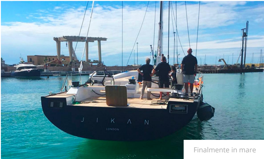
Finalmente in mare