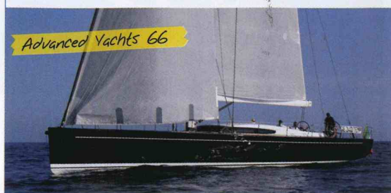
Advanced Yachts 66