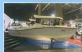
QUICKSILVER CAPTUR 755 PH