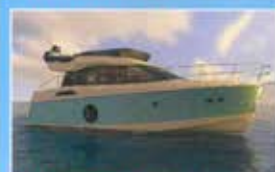
MONTE CARLO MC4