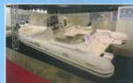
LOMAC ADRENALINA 7.5