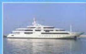
CRN CHOPi CHOPi M 80