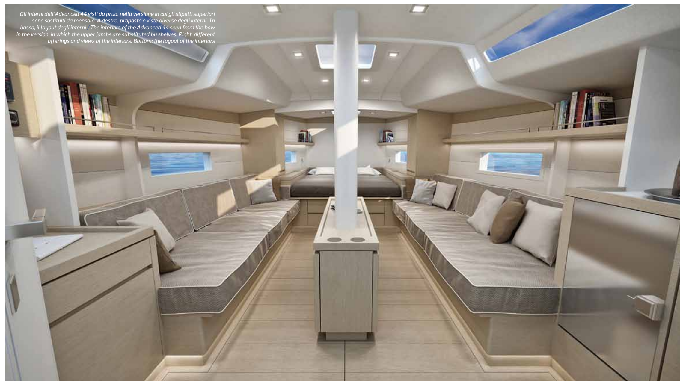
Gli interni dell'Advanced 44 visti da prua, nella versione in cui gli stipetti superiori sono sostituiti da mensole. A destra, proposte e viste diverse degli interni. In basso, il layout degli interni / The interiors of the Advanced 44 seen from the bow in the version in which the upper jambs are substituted by shelves. Right: different offerings and views of the interiors. Bottom: the layout of the interiors