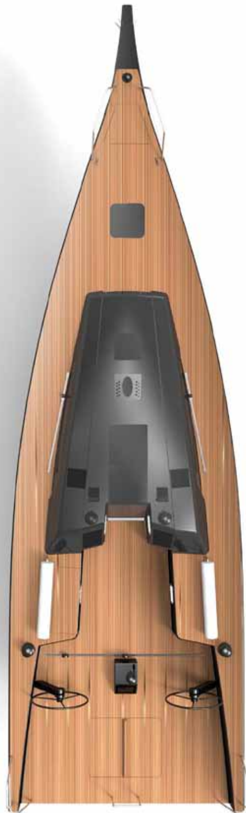
Una vista del piano di coperta che ben evidenzia come il baglio massimo si prolunghi fino a poppa senza variazioni / A view of the deck plan which clearly illustrates how the maximum beam extends all the way aft

producing a boat with the feeling and performance of a pure racer." The A44's waterlines also have the very positive knock-on effect of greatly increasing the surface area of the stern and the size of the interior